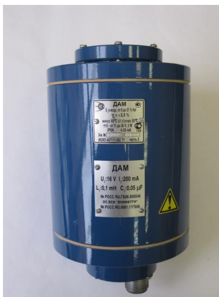
Рисунок 3. Внешний вид газоанализаторов исполнения ИБЯЛ.407111.002-15,-16,-22...-24 с диффузионным способом отбора пробы