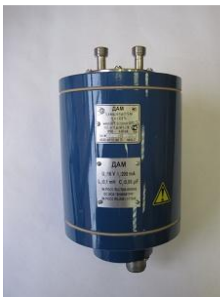
Рисунок 2. Внешний вид газоанализаторов с принудительным способом отбора пробы исполнения ИБЯЛ.407111.002-02...-49