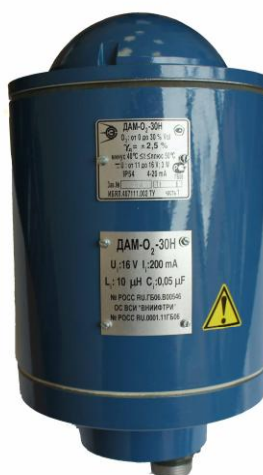
Рисунок 1. Внешний вид газоанализаторов ИБЯЛ.407111.002,-01 с диффузионным способом отбора пробы

Схема пломбировки от несанкционированного доступа и обозначение мест для нанесения оттисков клейм приведена на рисунке 4.