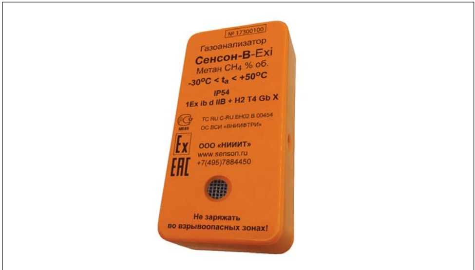
Рис. 2. Индивидуальный газоанализатор "Сенсон-В"

Автокалибровка происходит при включении прибора, при этом устанавливаются показания нормального содержания кислорода в атмосфере 20,9%.